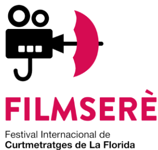
Imatge 2: Logo definitiu acordat per l'alumnat