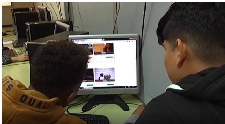
Imatge 4: Primera fase de selecció de curts rebuts