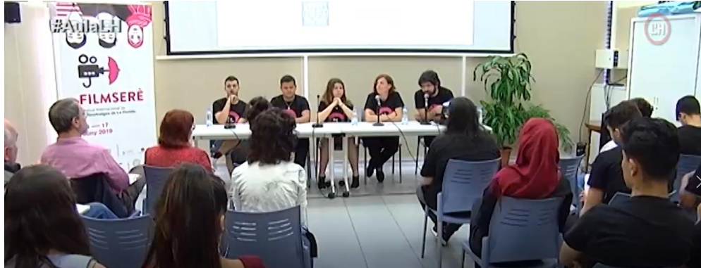
Imatge 5: Roda de premsa de presentació del Festival