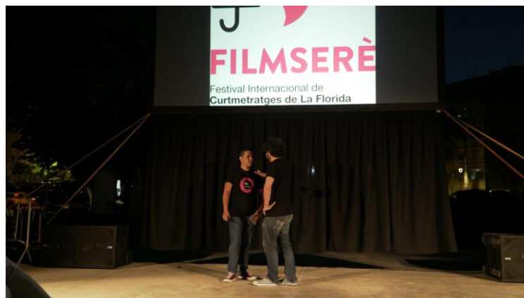
Imatge 7: Projecció a l'aire lliure al Parc de la Pau, el 15 de juny de 2019, davant 200 persones.

També es dona difusió a l'esdeveniment assistint a esdeveniments del barri i presentant-lo en persona (projeccions de cinema del Grup Cinema al Barri, projeccions de cinema a l'aire lliure del Centre Cultural La Bòbila, etc.).