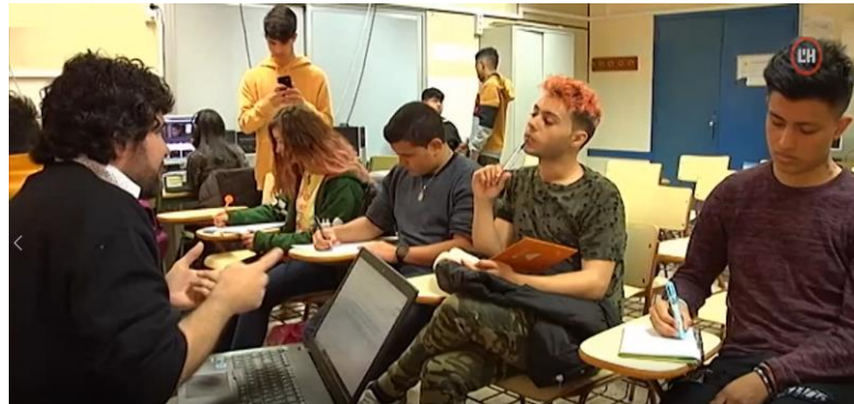
Imatge 1: una sessió de l'optativa de cinema