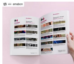
Imatge 3: Programa del Filmserè – FICF 2019