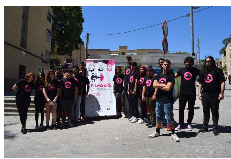
Imatge 6: Equip al complet del Filmserè – FICF 2019

Al mateix temps, els alumnes han de treballar en xarxa amb els professionals que participen al projecte (dissenyadors gràfics, dissenyador web, realitzador i muntador audiovisual, etc.), amb els alumnes del CFGS d'Administració i Finances que col·laboren en la gestió dels pressupostos, amb tots els col·laboradors, etc.